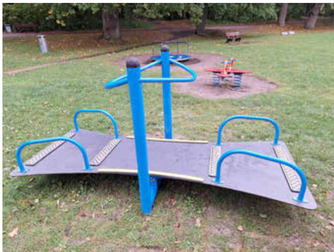
Foto: Rollstuhlgeeignete Stehwappe am Inselseestrand

Die Mehrgenerationsschaukel an der Badestelle am Inselsee konnte nicht wie gewünscht errichtet werden, da keine derartige Schaukel unter 10.000,00 € die Zulassung für öffentliche Räume hat. In Rücksprache mit dem Bürger, welcher den Vorschlag eingebracht hat, wurde sich alternativ für eine Rollstuhl-geeignete und somit barrierearme Stehwappe für die Badestelle entschieden.