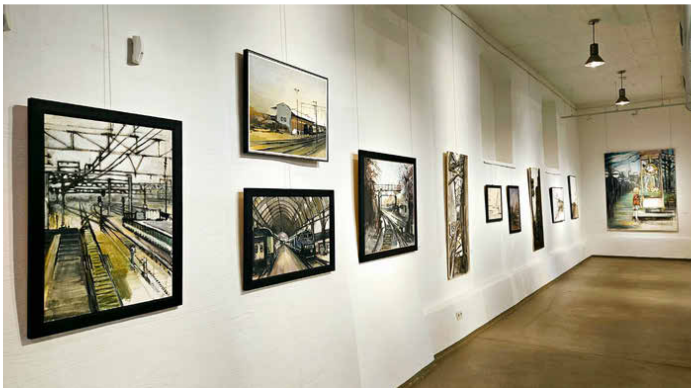
Foto: Blick in die Ausstellung Anja Brachmann: Perspektiven – Malerei, Grafik und Installation

Den Güstrower Stadtanzeiger können Sie auch im Internet lesen unter www.guestrow.de/stadt-kultur-politik/stadtanzeiger