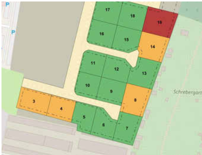
Karte Petershof (rot – verkauft | orange – reserviert | grün – frei)

Die Baugrundstücke im Baugebiet „Suckower Tannen“ befinden sich im Bereich der rechtskräftigen Bebauungspläne Nr. 6a und 6b. Der aktuelle Durchschnittspreis liegt derzeit bei 119,99 €/m 2 (Stand 06.01.2025). Der Erwerb wird an eine Bauverpflichtung innerhalb von 5 Jahren geknüpft.