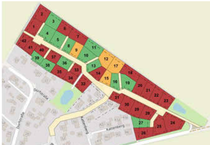
Karte Suckower Tannen

(rot – verkauft | orange – reserviert | grün – frei)