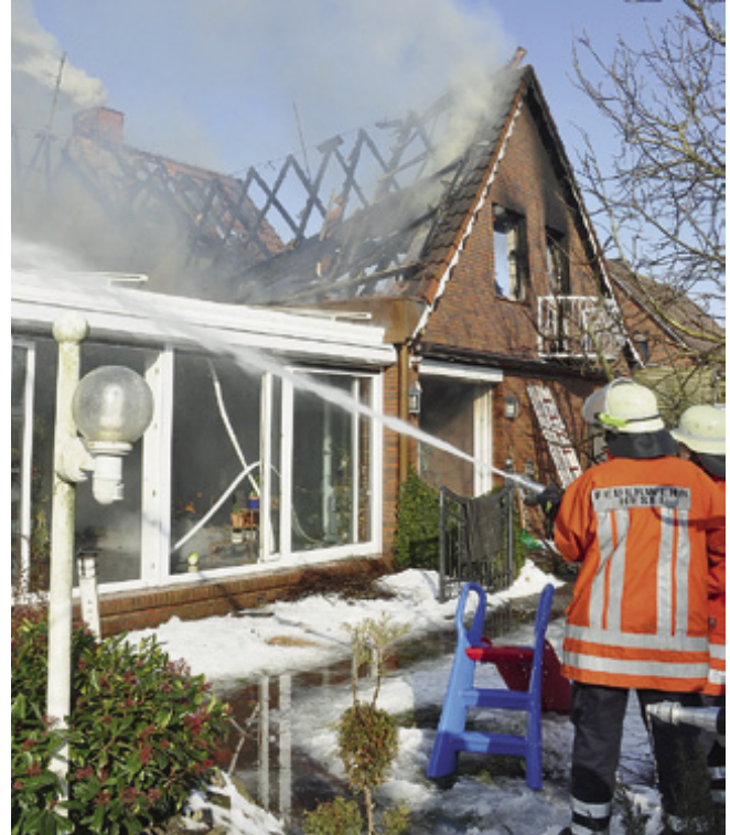
Bei der Gefahr von herabstürzenden Teilen löscht die Feuerwehr den Brand aus sicherer Entfernung.

■ Der Blitzschutz sollte nach den gültigen Normen ausgeführt sein.