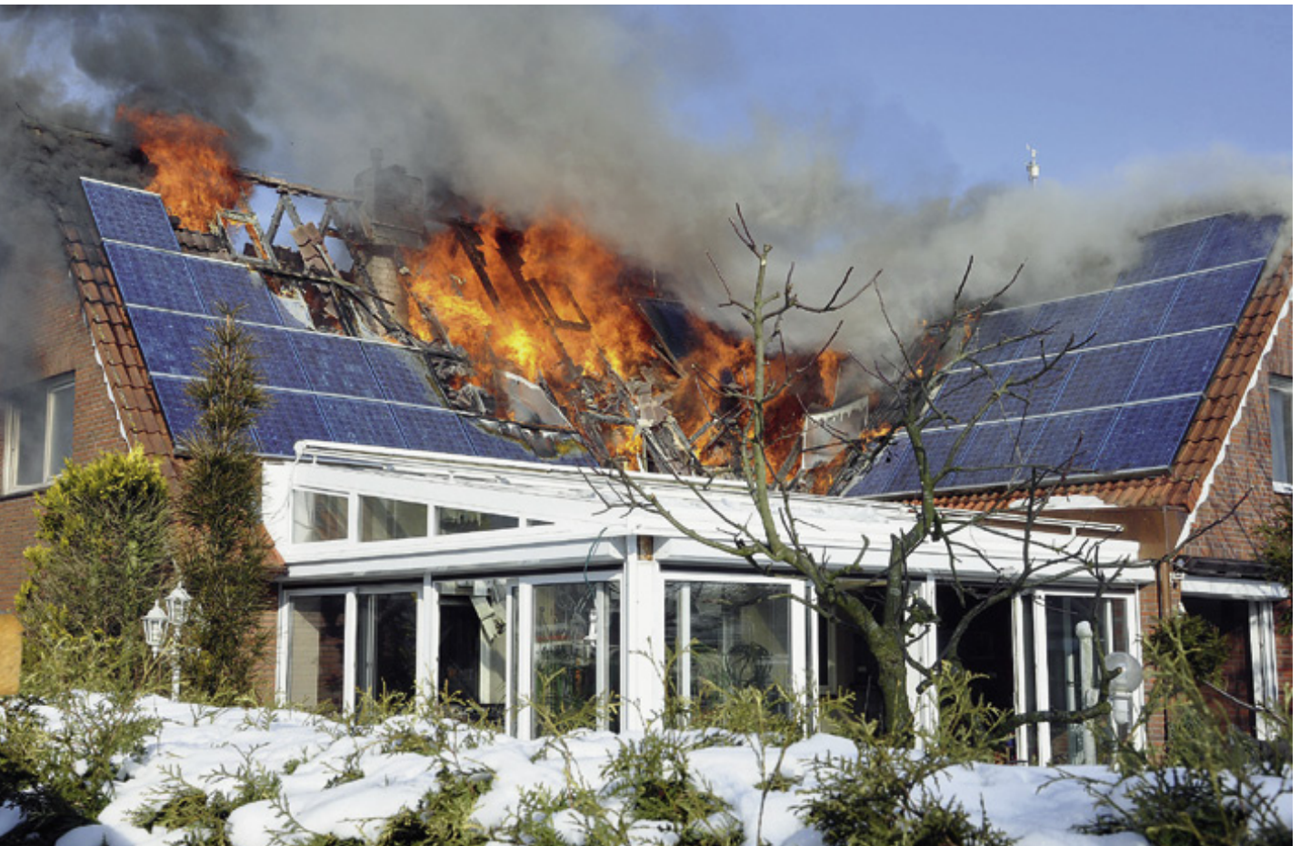
Brennende Solaranlagen werden häufig nicht gelöscht, weil die Gefahr eines elektrischen Schlags für die Feuerwehr besteht.