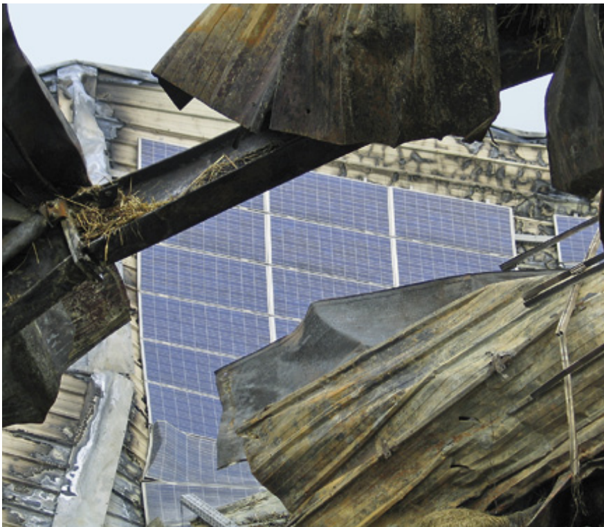
Bei einem Dachstuhlbrand fällt die Konstruktion zusammen mit den Modulen meistens nach innen, wie hier im Bild zu sehen ist.

Bisherige Versuche zum Abschalten der Anlage haben sich als nicht prakti-